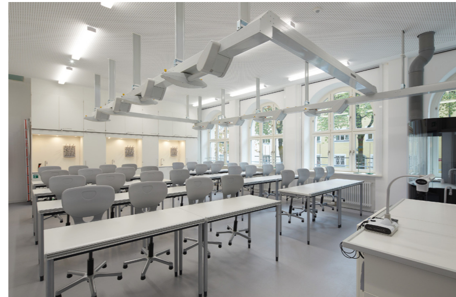
Die Fachlehrsäle sind mit neuester Technik ausgestattet.