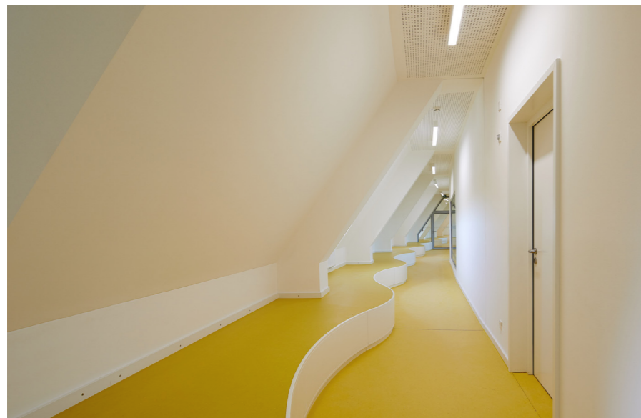
Im Oskar-von-Miller-Gymnasium sind neue Flure und Klassenräume im Dachgeschoss entstanden.