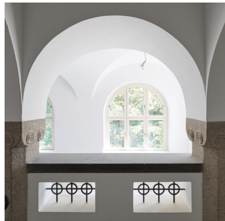
Die historischen Gewölbe wurden wieder instandgesetzt.