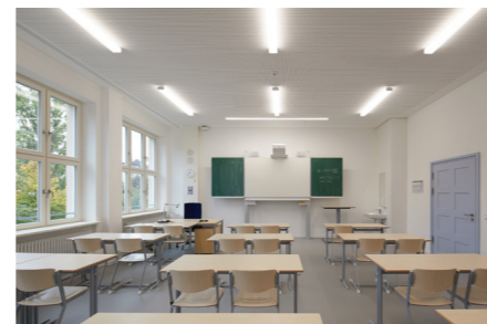
Neues Klassenzimmer im Maximiliansgymnasium