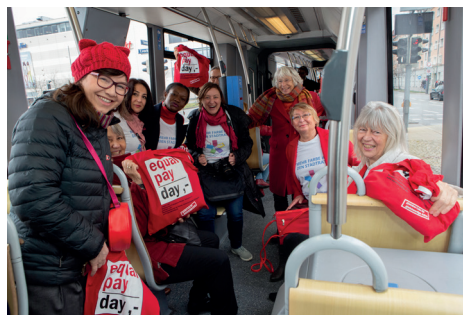
Gratis Tramfahrt durch München zum Auftakt 2020