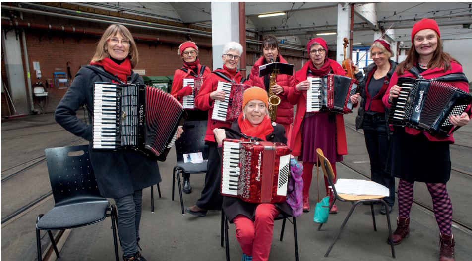
Die Quetschenweiber spielen das selbstkomponierte Equal Pay Day Lied im Tram-Depot