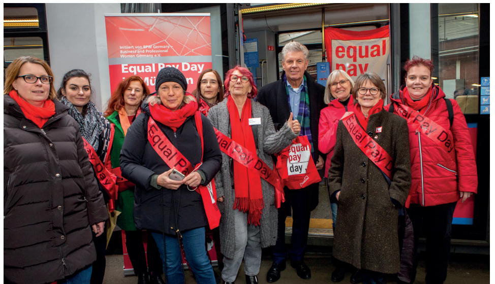
Schirmherr OB Dieter Reiter mit Projektteam beim Tram-Start 2020

Dagegen misst der bereinigte Gender Pay Gap (6%) den Verdienstunterschied zwischen Männern und Frauen mit vergleichbaren Qualifikationen, Tätigkeiten und Erwerbsbiografien; strukturelle Faktoren werden hier also weitgehend herausgerechnet.