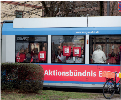
EPD-Tram 2020 am Max-II