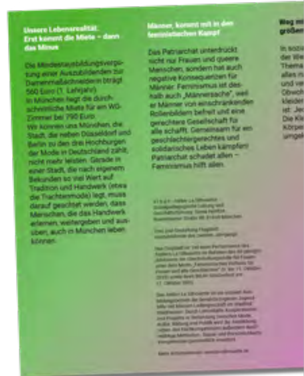
Das Flugblatt war Teil der Performance des Ateliers La Silhouette im Rahmen des 40-jährigen Jubiläums der Gleichstellungsstelle für Frauen

Feminismus kann vielfältig, kraftvoll und sichtbar sein.