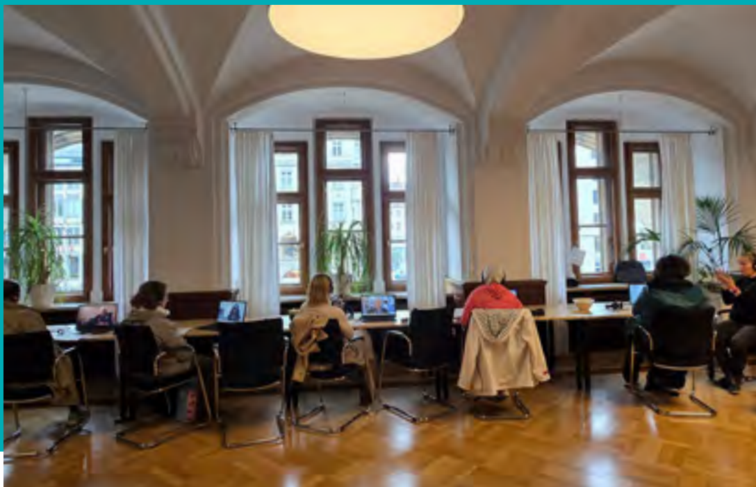
Filmscreening „Oral History“