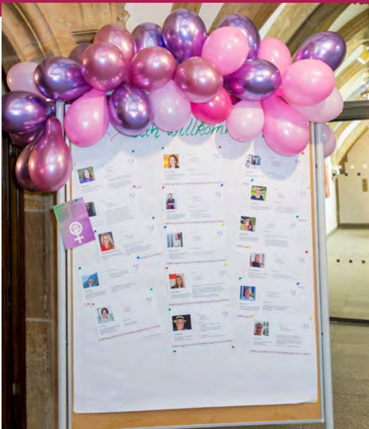
Die örtlichen Gleichstellungsbeauftragten stellen sich vor