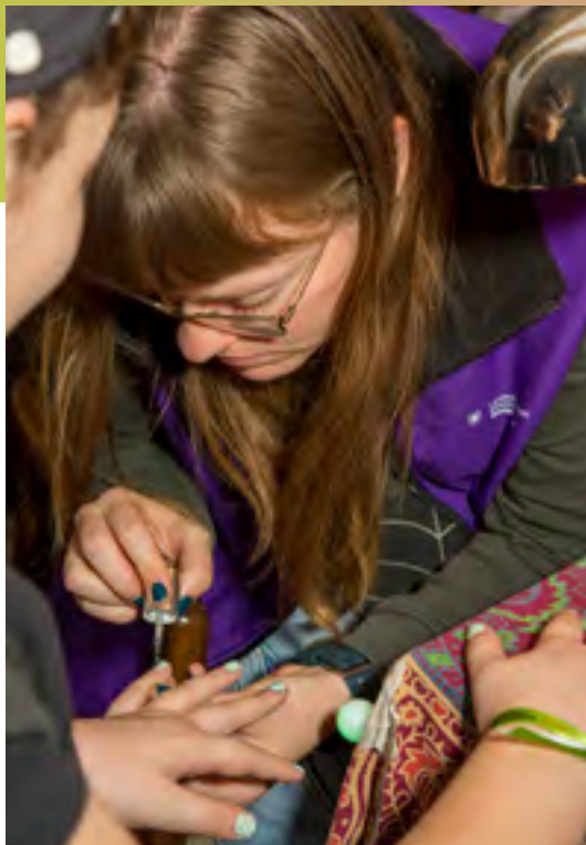
im Uhrzeigersinn: Stand Social Media, Stand Endometriose, Awareness-Team