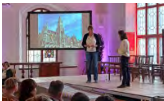
Künstlerische Begleitung durch „Vitamin T – Die Bühne für Veränderung“

Ein wesentlicher Auftrag zur Verbesserung der Lage liegt aber auch bei den Unternehmen. Zum Beispiel in Bezug auf die Einstellung und Förderung von Frauen. Mit dem Argument „sie könnte ja schwanger werden und ausfallen“ wird Diskriminierung in großem Ausmaß betrieben. Wenn Führungspositionen überwiegend mit Männern besetzt und Vätermomente belächelt werden, Teilzeit für Männer einen Karriere-stopp bedeutet, dann bleibt nicht nur das Know-how von Frauen auf der Strecke, dann werden der Gleichberechtigung der Geschlechter ganz bewusst Steine in den Weg gelegt.