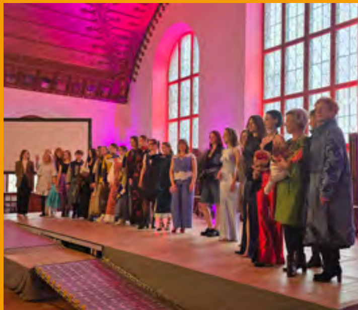
Alexandra Yepes Fotos rechts oben und unten: Modenschau und Textilworkshop

Der praxisorientierte Workshop „Deine Stimme in allen Sprachen – erstelle Deinen Avatar und verstärke Deine Botschaft mit KI“ zeigte, wie künstliche Intelligenz unterstützen kann, digitale Avatare zu erstellen, die in verschiedenen Sprachen sprechen können. Eine gute Möglichkeit für Projekte, Initiativen und Vereine, ihre Anliegen auf sozialen Plattformen besser sichtbar zu machen. Die Inhalte können barrierefrei und mehrsprachig und damit inklusiver erstellt werden und wie in dem Workshop deutlich wurde, muss „frau*“ dafür keine Spezialistin sein. Gleichzeitig wurden den Teilnehmenden die Gefahren der Deep-Fake-Technologie bewusst, denn mithilfe eines einfachen Fotos von einer Person kann ein sprechendes Video erzeugt werden, in dem die abgebildete Person Dinge sagt und tut, die sie in Wirklichkeit vielleicht niemals tun oder äußern würde. Das zeigt, wie wichtig es ist, genau und kritisch hinzusehen und Informationen zu überprüfen.