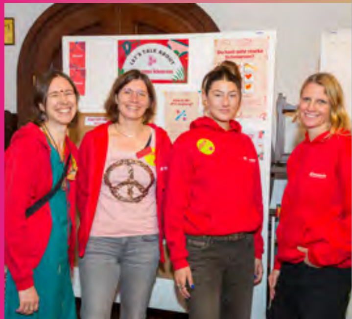
Team Städtische Berufsschule und Team amanda – für Mädchen und junge Frauen