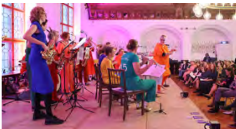
Schwungvoller Festempfang mit Groove Sistaz

Nochmal vielen Dank an alle, die in diesen vier Jahrzehnten dafür gekämpft haben. Wir können versprechen, wir werden es auch weiterhin tun.