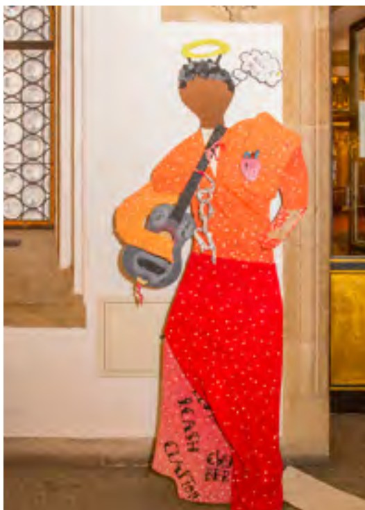
Figur Sister Rosetta Tharpe aus der Ausstellung „Say Her Name“

Diese Festschrift zum 40-jährigen Jubiläum der Gleichstellungsstelle für Frauen zeichnet ein Bild des „Feministischen Rathauses für Frauen und alle Geschlechter“: Wie vielfältig sind die Themen, die uns zu Gleichstellung und Feminismus bewegen. Wie vielfältig sind diejenigen, die sich dazu versammeln, verbünden und engagieren. Und wie umfangreich sind noch unsere Herausforderungen, die wir für eine gleichberechtigte Gesellschaft bewältigen müssen. Das gesamte Jubiläums-Konzept stand unter dem Motto „Verbündet sein“: Im Feministischen Rathaus für Frauen und alle Geschlechter wurde drei Tage lang öffentlich gezeigt, dass Verbundenheit trotz verschiedenster Akteur*innen und unterschiedlichster Aktionsformen möglich und nötig ist und ein gleichberechtigtes Leben sehr viel Spaß macht!