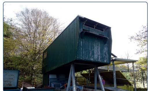
Taubenhaus auf Stelzen