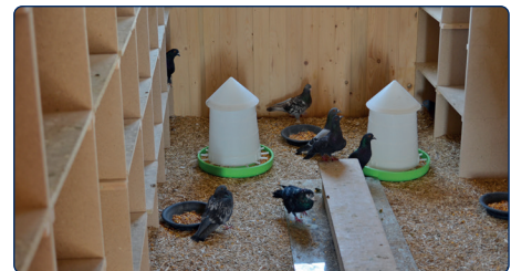
Versorgung im Taubenhaus