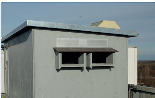
Taubenhaus auf einem Flachdach

Eine weitere Möglichkeit sind Taubentürme und Taubenhäuser, die mit Stelzen erhöht wurden. Diese sollten möglichst an ruhigen Orten aufgestellt werden, welche aufgrund von Vandalismusgefahr nicht öffentlich zugänglich sind.