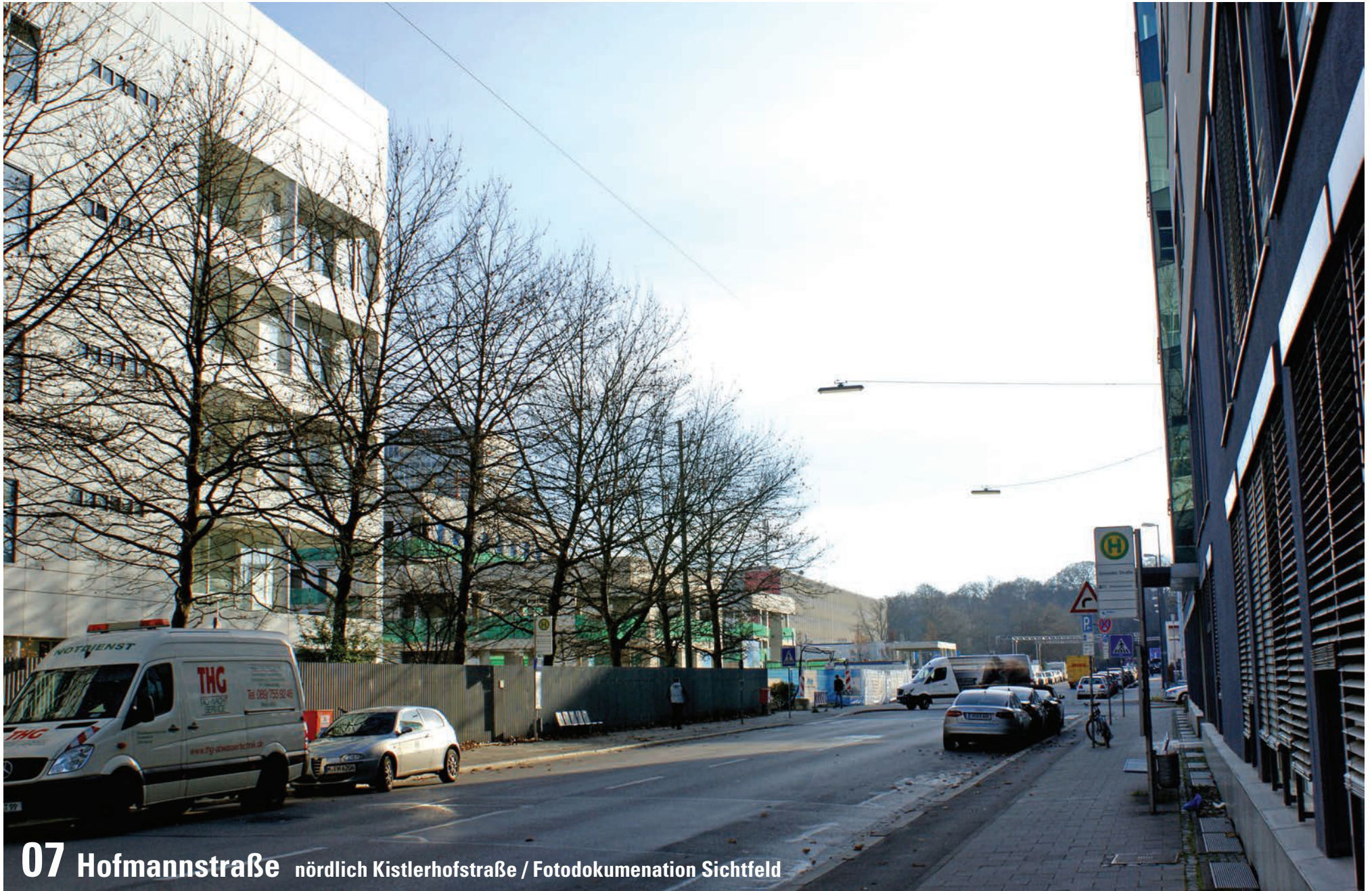
07 Hofmannstraße nördlich Kistlerhofstraße / Fotodokumentation Sichtfeld