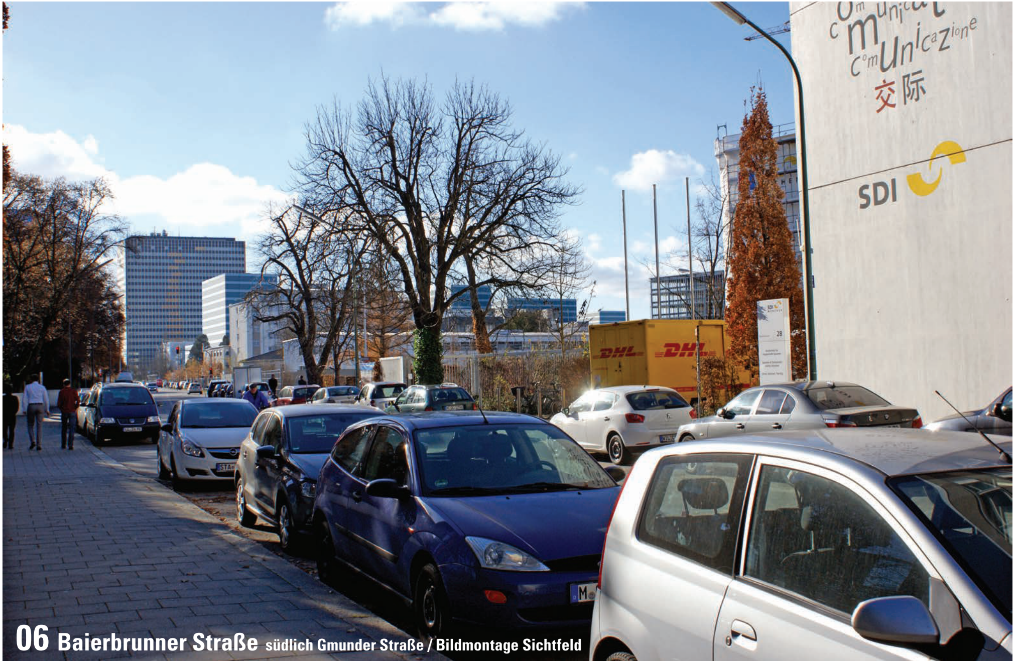
06 Baierbrunner Straße südlich Gmunder Straße / Bildmontage Sichtfeld