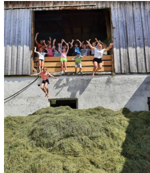
Ferienfreizeit in Kaps – Josef Schörghuber-Stiftung für Münchner Kinder