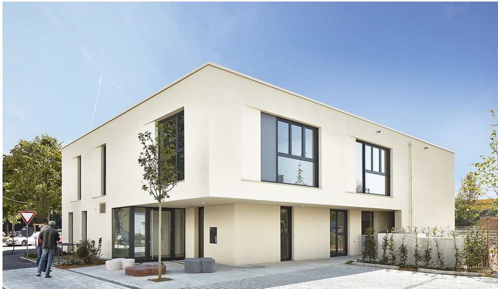
Ansicht von Nordosten, Eingang und Vorplatz zur Josef-Obenhin-Straße