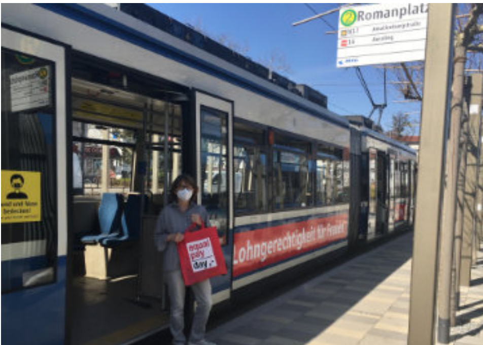
Mit roter Tasche dabei ... EPD Tram 2021 am Romanplatz