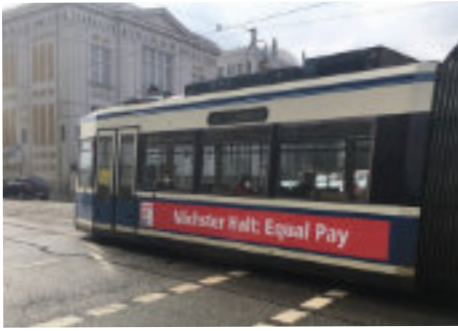
Die EPD Tram an der Villa Stuck 2021