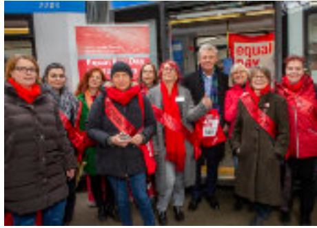
Schirmpaten OB Dieter Reiter mit dem EPD Projektteam kurz vor dem Tram-Start 2020