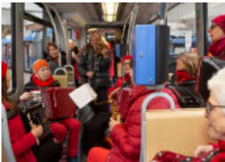
Auf geht's zur ersten Fahrt 2020 mit den Quetschenweibern ...