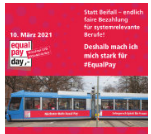
Die Social Media Aktion 2021 – wird mit dem Motto von 2022 weitergeführt!

2021 gab es Corona bedingt leider keine Auftaktveranstaltung aber ein virtuelles Video aus dem Tram-Depot mit Grusswort und vielen Infos zum EPD: https://youtu.be/_sTb14t9axU