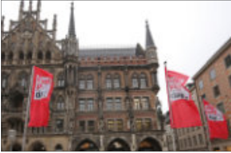
Zum Equal Pay Day wehen die Fahnen vor dem Münchner Rathaus