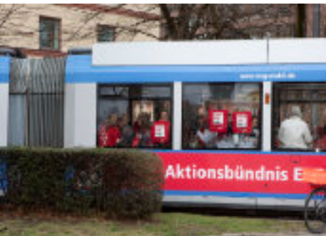
EPD Tram 2020 am Max-II