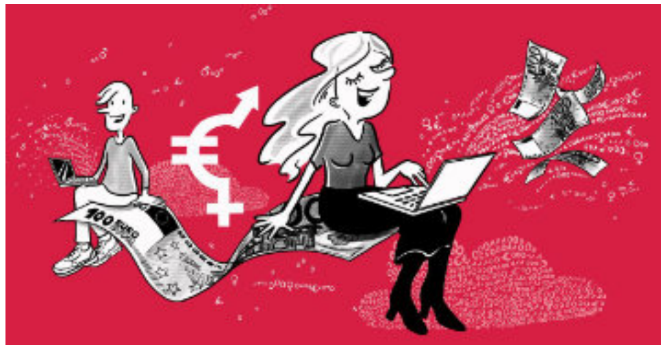
Illustration EPD 4.0 für die Aktion 2022

eine gerechte Bezahlung zwischen Frauen und Männern aus? Wie schaffen wir mehr Geschlechter- und Lohngerechtigkeit oder kommt es jetzt wieder zu einer zusätzlichen Benachteiligung von Frauen?