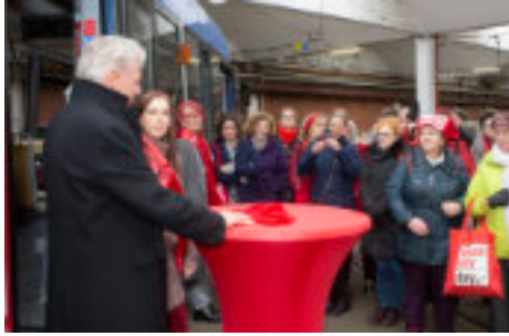
Ansprache von OB Dieter Reiter vor Bündnispartnerinnen im Tram Depot 2020