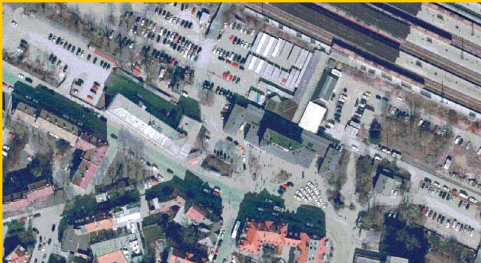
Luftbild Bahnhof Pasing Bestand