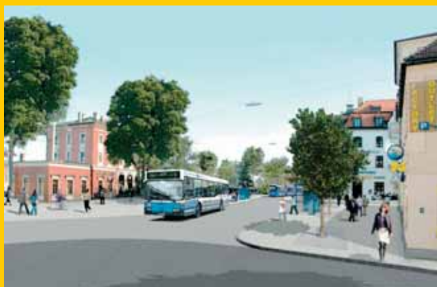
Bahnhof Pasing Planung