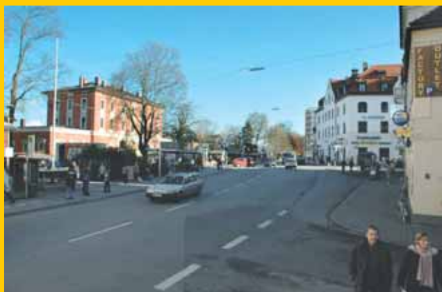
Bahnhof Pasing Bestand