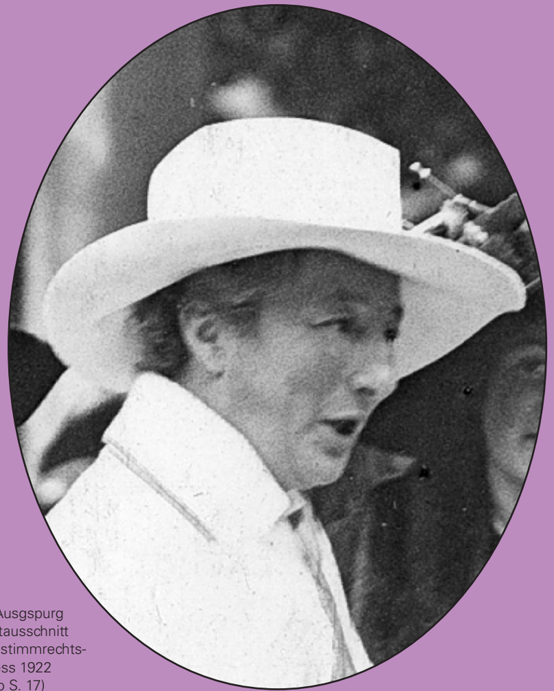
Anita Augspurg Portraitausschnitt Frauenstimmrechts- kongress 1922 (s. Foto S. 17)

Auf der Grundlage dieser Empfehlung beschloss der Stadtrat am 1. Juni 1994 den Anita Augspurg Preis einzurichten. In der Beschlussvorlage hieß es unter anderem: