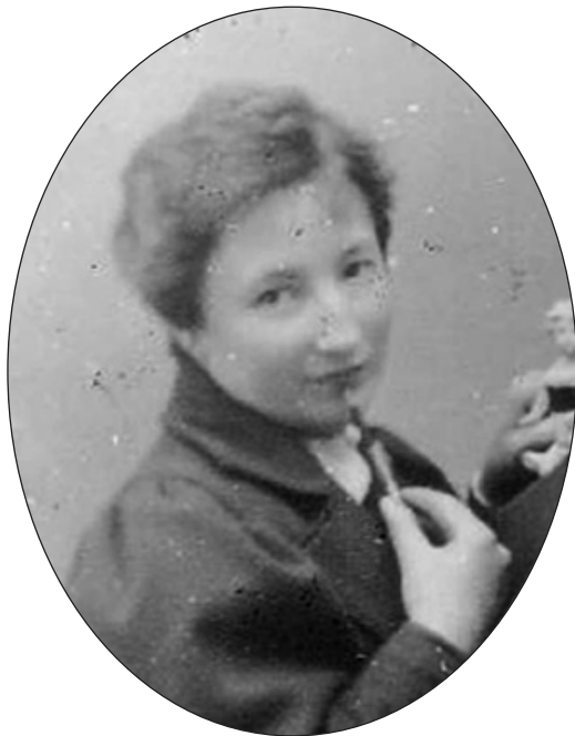
Anita Augspurg Detail aus einer Aufnahme des Ateliers Elvira um 1894

Zwischen der Gleichberechtigung von Frauen und Männern auf dem Papier und der gesellschaftlichen Realität klafft, dies ist allgemein bekannt, immer noch eine große Lücke. Die Gleichstellung der Geschlechter kommt nicht von selbst. Sie ist nur durch ein konsequentes, innovatives und mutiges Handeln erreichbar. Die Stadt München hat mit der Einrichtung einer Gleichstellungsstelle für Frauen einen wichtigen Beitrag geleistet. Die große, alle gesellschaftlichen Bereiche umfassende Aufgabe der Gleichstellung der Geschlechter kann weder die Stadt noch die Gleichstellungsstelle allein bewältigen. Sie verlangt vielfältige und engagierte Aktionen und Initiativen. Der Innovationspreis sollte dazu dienen, vorbildliche Leistungen zur Gleichberechtigung von Frauen bekanntzumachen und damit weitere Initiativen anzustoßen.“