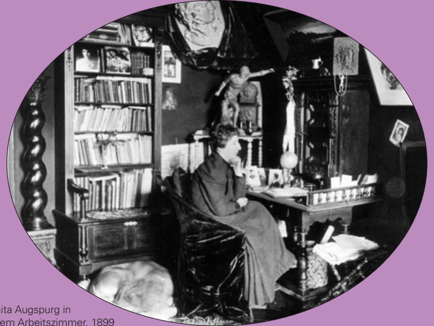
Anita Augspurg in ihrem Arbeitszimmer, 1899