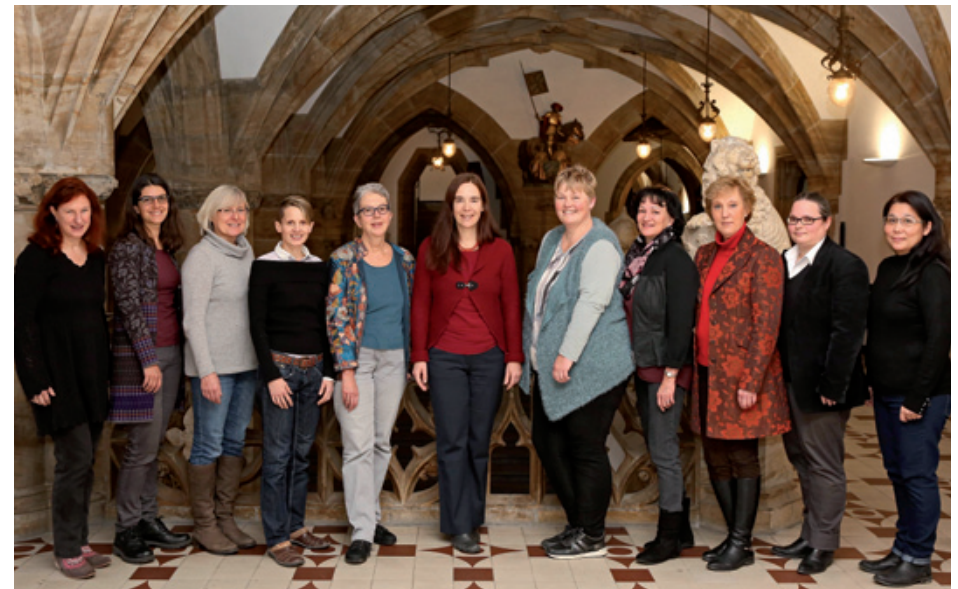
Team der Gleichstellungsstelle für Frauen

ein Preissignet zur Verfügung, das sie im Rahmen ihrer Öffentlichkeitsarbeit verwenden können.