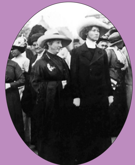
Lida Gustava Heymann und Anita Augspurg in Budapest 1913

Anita Augspurg kritisiert öffentlich die Entwürfe zum Bürgerlichen Gesetzbuch (BGB), die im Reichstag in Berlin debattiert werden, vor allem die darin verankerte Benachteiligung verheirateter Frauen: die alleinige Verfügungsgewalt des Ehemanns über Kinder und Vermögen, den „unwürdigen“ Zwang zur Aufgabe des eigenen Namens, die andauernde Bevormundung, die Rechtslosigkeit bei nichtehelichen Kindern. Sie kämpft für die Reform des Familienrechts, die Entkriminalisierung der Prostitution und die Streichung des § 218 StGB.