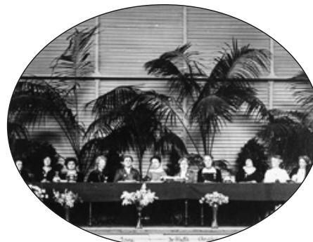
Internationaler Frauenfriedenskongress, Den Haag 1915

Frauen im Krieg hineinzuschreiben. Abgesandte der Konferenz übergeben persönlich die Resolution der deutschen und dreizehn weiteren Regierungen – bekanntlich folgenlos. Auf dem Kongress in Den Haag wird der „Internationale Ausschuss für einen dauerhaften Frieden“ gegründet, aus dem 1918 die „Internationale Frauenliga für Frieden und Freiheit“ (IFFF) hervorgeht. Anita Augspurg gehört dem Vorstand der deutschen Sektion der Liga bis 1933 an.