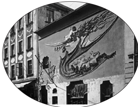
Atelier Elvira, Fassade, Von-der- Tann-Straße 15