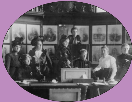
Verband fortschrittlicher Frauenvereine im Reichstag 1901, dritte v. rechts Anita Augspurg

Anita Augspurg schließt ihr Jura-studium in Zürich mit der Promotion ab (Thema der Doktorarbeit: „Über die Entstehung und Praxis der Volksvertretung in England“) und ist damit die erste deutsche Juristin. Sie siedelt nach Berlin um, wo sie – mit Minna Cauer, der Vorsitzenden des Vereins „Frauenwohl Berlin“ und Herausgeberin der Zeitschrift „Die Frauenbewegung“ – bald im Zentrum der radikalen Frauenbewegung steht. Ihre juristischen Kenntnisse münden in den nächsten Jahren in politische Forderungen – vor allem nach der Reform des Familienrechts – an den deutschen Reichstag, den sie mit einer Sondergenehmigung betreten darf. Ab 1899 helfen ihr die juristischen Kenntnisse bei der Redaktion der Beilage „Parlamentarische Angelegenheiten und Gesetzgebung“ der Zeitschrift „Die Frauenbewegung“. 1907 tritt an deren Stelle die „Zeitschrift für Frauenstimmrecht“, Herausgeberin ist Anita Augspurg.