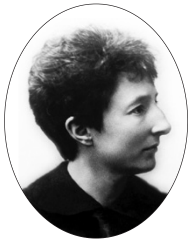
Anita Augspurg

Am 16. September hält sie eine Rede zur Eröffnung des ersten deutschen Mädchengymnasiums in Karlsruhe, dessen Abschlussprüfung zum Studium an deutschen Hochschulen berechtigt. Neben zwei frühen Ratgebern („Pflege deine Blumen. Kleine Ziergärtnerei“, 1892, und „Wie kleide ich mich? Praktische Anleitung zur gesundheitsmäßigen und geschmackvollen Kleidung für Jedermann“, 1893) erscheint in diesem Jahr auch ihr einziges Buch: „Die ethische Seite der Frauenfrage“.