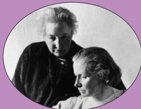
rechts: Lida Gustava Heymann und Anita Augspurg (um 1920)

Anita Augspurg und Lida Gustava Heymann beziehen in München in der Kaulbachstraße 12a eine gemeinsame Wohnung. In den Sommermonaten leben sie in den folgenden Jahren auf dem Land. Nach einem gemeinsamen landwirtschaftlichen Kurzstudium bewirtschaften sie – angeblich nur mit Frauen – nacheinander zwei große Höfe.