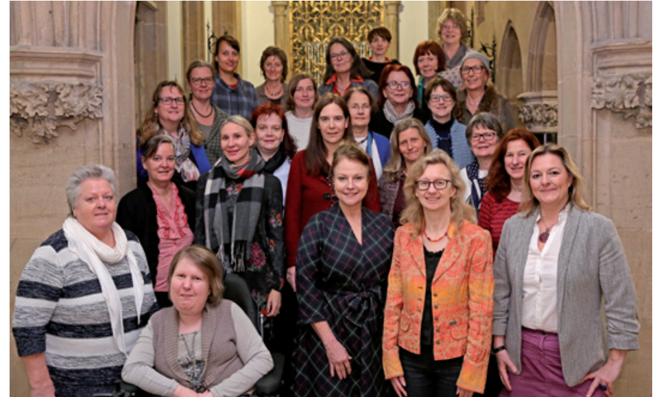
Stadtratskommission zur Gleichstellung von Frauen, 2019

Die Preisverleihung findet im Rahmen des alljährlichen Empfangs des Oberbürgermeisters der Landeshauptstadt München zum Internationalen Frauentag statt.