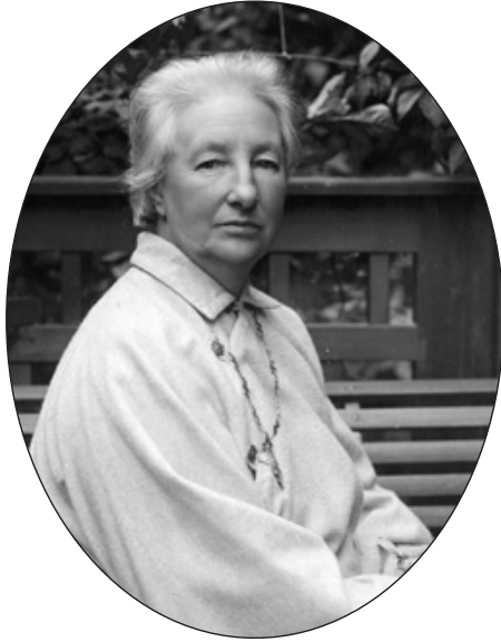
Anita Augspurg