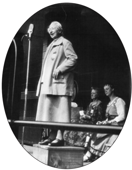
Anita Augspurg vor dem Mikrophon, Rede anlässlich des WLPF-Congress 1937

Nach der Machtübernahme durch die Nationalsozialisten kehren Anita Augspurg und Lida Gustava Heymann von ihrer Winterreise nach Mallorca nicht mehr nach Deutschland zurück – sie stehen seit dem versuchten Hitlerputsch von 1923 auf der Liste der zu liquidierenden Personen. Bereits damals hatten sie vom bayerischen Innenminister verlangt, Adolf Hitler wegen Volksverhetzung als unerwünschten Ausländer nach Österreich auszuweisen. Die beiden Frauen werden ausgebürgert, ihr Besitz wird beschlagnahmt, ihr umfangreiches Archiv vermutlich vernichtet. Beide leben fortan, unterstützt von Freundinnen und Freunden, im Exil in Zürich. Sie arbeiten weiter für die IFFF und an der Aufzeichnung ihrer Erinnerungen und versuchen durch journalistische Arbeit ihren Lebensunterhalt aufzubessern.