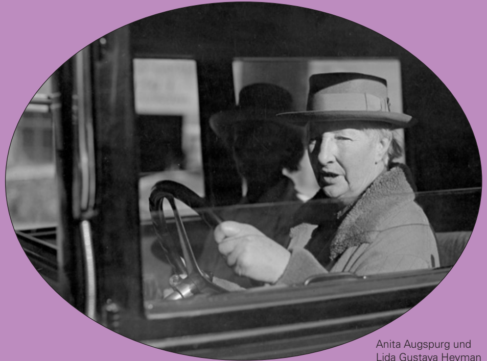
Anita Augspurg und Lida Gustava Heymann im Auto.