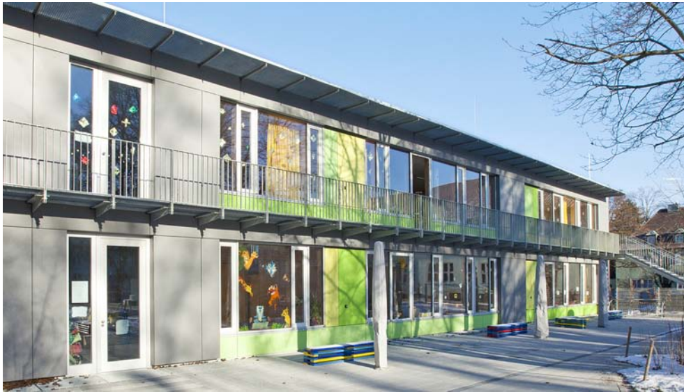
Ansicht Gartenseite von Südosten

Baureferat Referat für Bildung und Sport